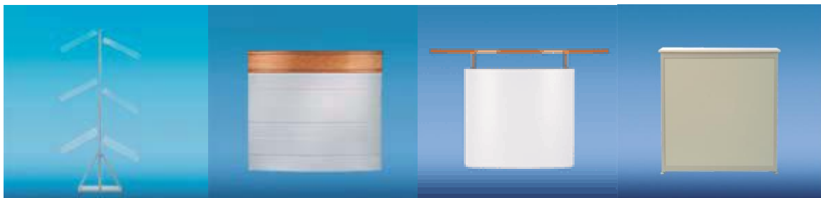
Literature rack „Uni“