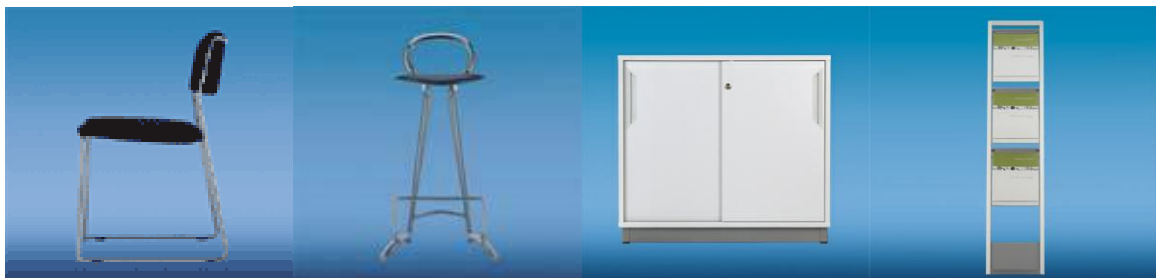
Polsterstuhl „Talin“, schwarz / chrom