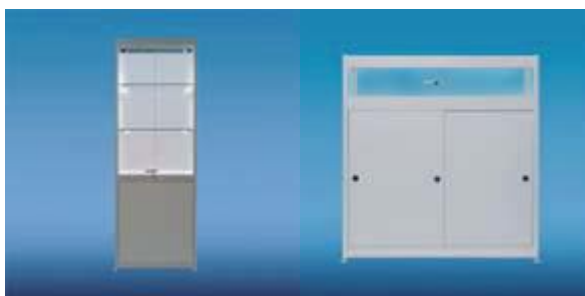
Standvitrine, weiss, abschließbar 100 x 50 + 200 cm“