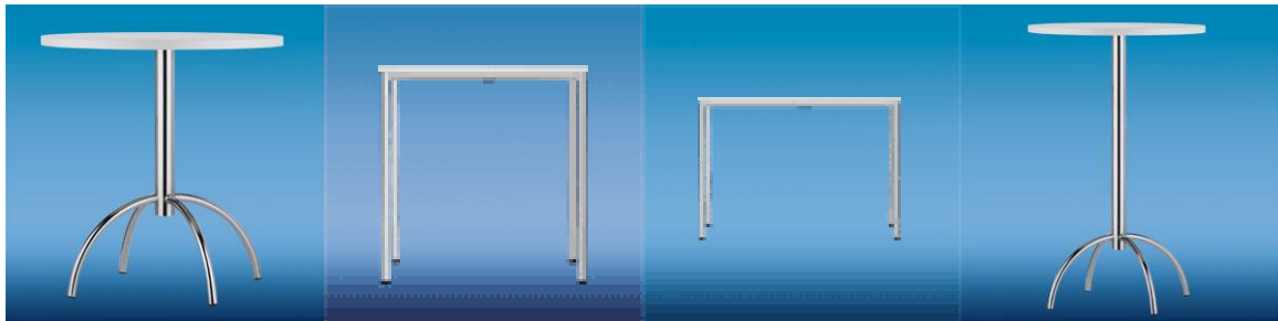
Tisch, weiss d = 70 cm